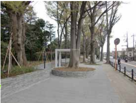
西側：松沢けやき公園