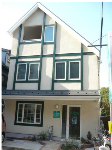
←「上北沢動物病院」外観

犬の散歩の時は尿の処理（水をかける等）をする事で桜の木を少しでも守る事ができるようなので、気をつけてもらいたいとのことです。