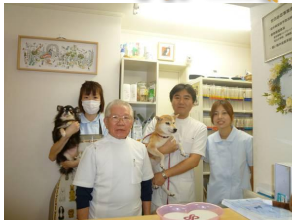
↑院長先生(右から2人目)とスタッフの方々↑