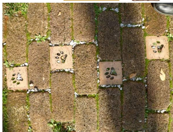
↑足下のレンガに犬の足跡↑