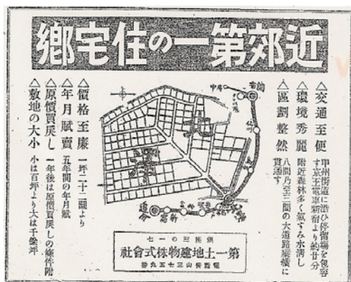
（「読売新聞」大正 13 年 10 月 19 日より）

私は北沢（筆者注 現在の北沢）を開く時、資金は、台湾で社長をしていた台湾土地建物会社の資金百五十万円を、臨時に融資して、大正 13 年第一土地建物株式会社を、銀座三丁目に創立したが、実は、台湾会社の株主からは大反対をうけた。東京の住宅地を、台湾の金で開くことは不当だというのである。私は、「台湾の会社に結局損をしないようにするから、しばらくの間、国の為だと思って見て貰いたい。」と説得して、北沢の計画に入ったのだ。これによって、私個人は少しも利得がなかったが、台湾の株主には迷惑をかけずにすんだ。今、省みても意義のある仕事をしたと思っっている。